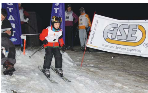
Na starcie ASE Cup w Slalomie Gigancie