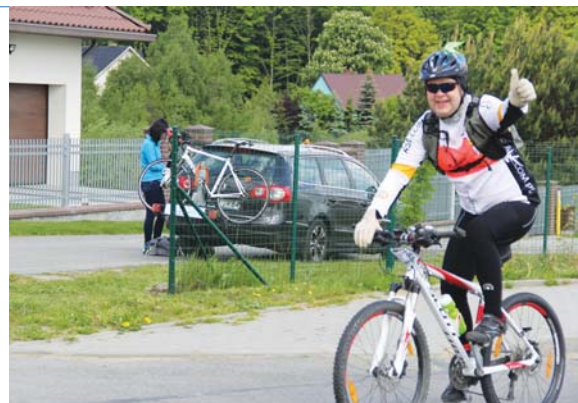
„Kaszebe Runda” 2015