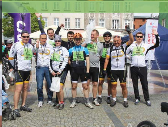
„Kaszebe Runda” 2015

Kolarstwo, biegi długodystansowe i narciarstwo alpejskie to najchętniej uprawiane przez pracowników grupy ASE dyscypliny sportowe. Reprezentantów firmy podczas weekendów spotkać można na wszystkich niemal organizowanych na Pomorzu masowych imprezach sportowych dla amatorów. W poniedziałki wracają do pracy z nową energią i mierząc się z trudnymi zawodowymi wyzwaniami, efektywnie przyczyniają się do wzrostu naszego PKB.