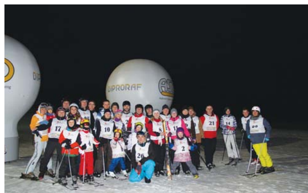
Uczestnicy I ASE Cup w Slalomie Gigancie

różnych imprezach o charakterze sportowo-rekreacyjnym. Czynne uprawianie sportu należy do dobrego tonu i sprawia, że liczba aktywnych uczestników imprez wśród pracowników grupy ASE stale rośnie. Ta ilość przeradza się też w jakość, co widać po wynikach firmy w różnych klasyfikacjach zespołowych. I choć nie stanowią one priorytetu (ważniejsze jest samo podejmowanie aktywności ruchowej), cieszą i motywują do treningów przed kolejnymi zawodami. A jeśli ma się już tak ciężko zapracowane sukcesy, to na koniec sezonu warto je zbilansować, przypomnieć oraz się nimi pochwalić. Bilansujemy, przypominamy i chwalamy się zatem, bo z całą pewnością na to zasłużyliśmy.