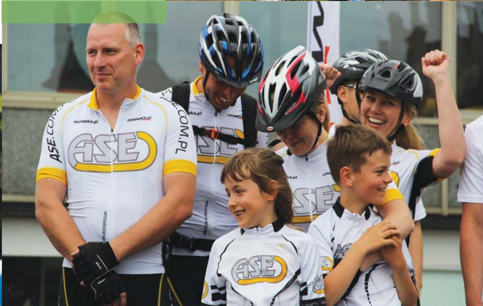
Na uroczystości „Rowerem do Pracy”