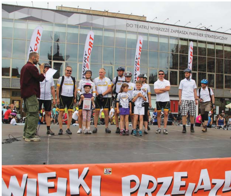
Zakończenie akcji „Rowerem do pracy” 2015