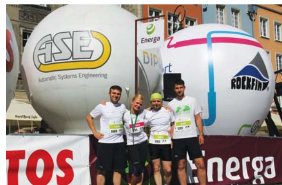
Bieg „Św. Dominika” 2015