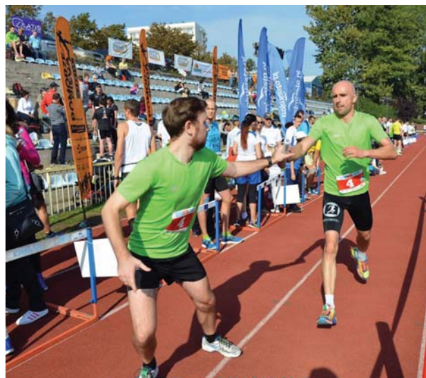
Sztafeta Firm 2015.

Pamiętając o społecznej misji wobec środowiska, Firma tradycyjnie nie była też obojętna na potrzeby organizatorów imprez sportowych. Nośniki reklamowe ASE zobaczyć można było na zawodach dla szkół podstawowych i gimnazjalnych: w Gdańsku podczas Lekkoatletycznych Czwartków, na pływackich zawodach o Puchar Prezydenta oraz w Rzeszowie podczas mistrzostw tego