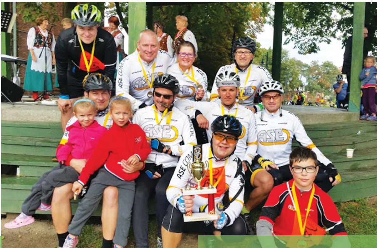
„Żuławy w Koło”