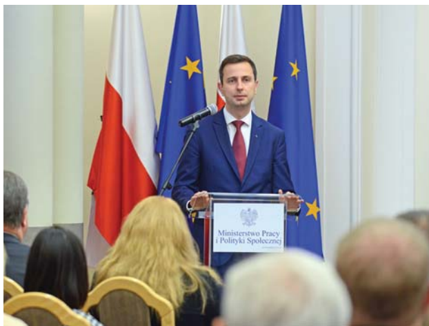
Minister Pracy i Polityki Społecznej Władysław Kosiniak-Kamysz

Wdrożenie systemu detekcji gazów w Browarze w Elblągu opisywaliśmy w poprzednim numerze „Biuletynu Technicznego”.